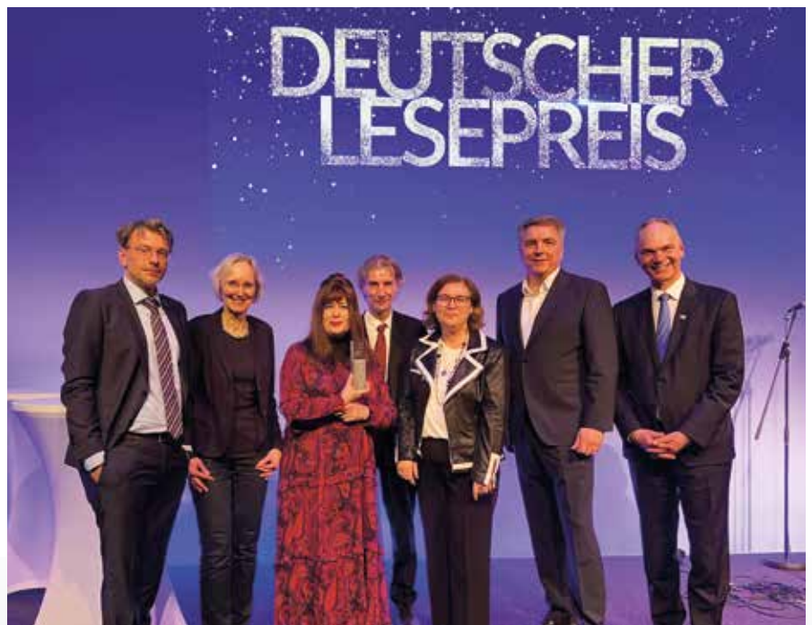
Die Oldenburger Kinder- und Jugendbuchmesse ist in der Kategorie Herausragendes kommunales Engagement mit dem Deutschen Lesepreis ausgezeichnet worden.