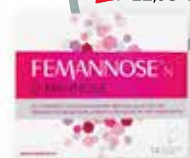
Femannose N 14 Btl. 1)2)