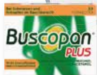
Buscopan Plus 20 FTA 1)2)

1.) Zu Risiken und Nebenwirkungen lesen Sie die Packungsbeilage und fragen Sie Ihren Arzt oder Apotheker. 2.) Unverbindliche Preisempfehlung des Herstellers. Nur solange der Vorrat reicht. Irrtümer und Änderungen vorbehalten. Abgabe nur in haushaltsüblichen Mengen. Angebote gültig vom 01.05.2024 bis zum 31.05.2024.