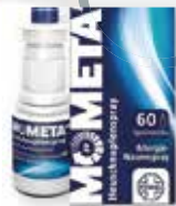
Mometahexal Heuschnupfenspray 10 g (100 g = 98,90 €) 1)2)