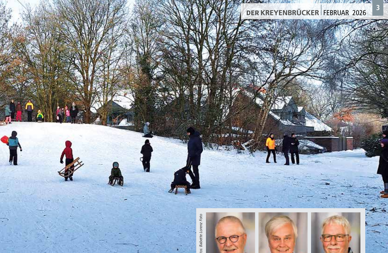
Kinder und Erwachsene hatten ihren Spaß auf dem Rodelhügel an der Kandinsky-Straße