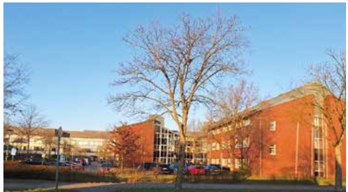
Das Lebensmittel- und Veterinärinstitut an der Martin-Niemöller-Straße