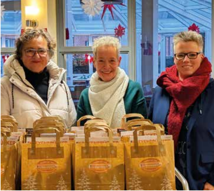
Hansa Seniorenzentrum II