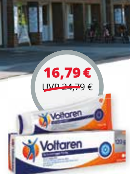
Voltaren forte Schmerzgel 120 g (100 g = 13,99 €) 1,2)