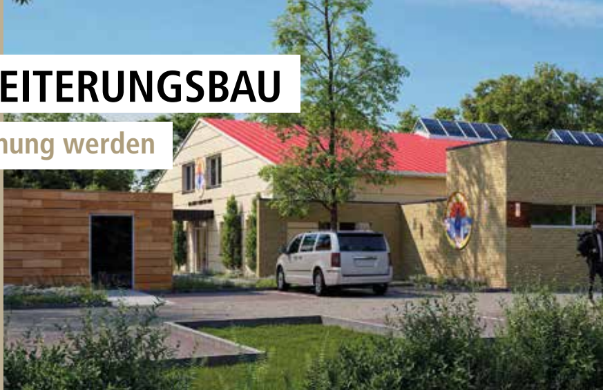
Vorderansicht des Erweiterungsbaues