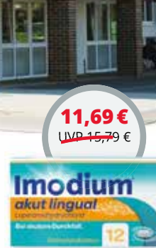
Imodium akut lingual 12 St. 1,2)