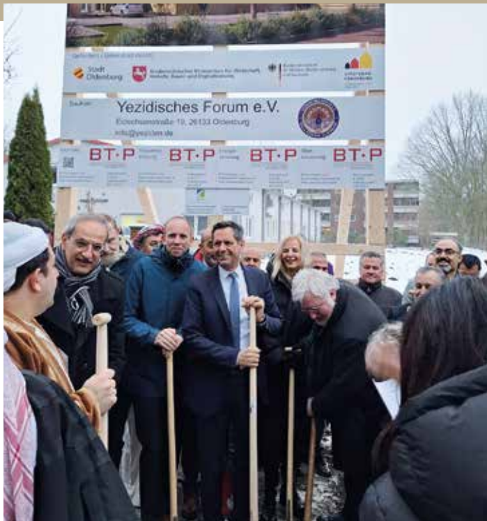
Ministerpräsident Olaf Lies und Repräsentanten der Yeziden beim 1. Spatenstich

ein hohes energetisches Niveau. Der Bau weist einen geringen Primär-Energiebedarf auf. Dieser wird überwiegend aus erneuerbaren Energien gedeckt. So werden die CO 2 -Emissionen deutlich reduziert.