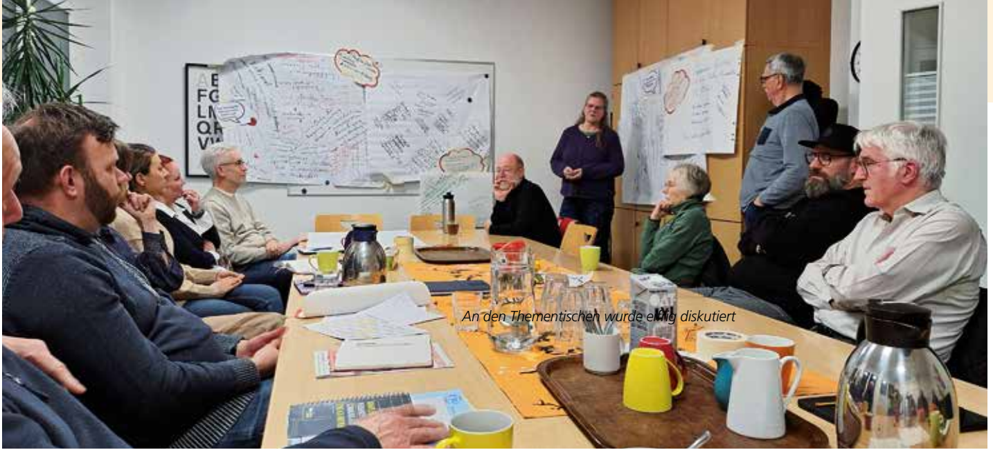
An den Thementischen wurde eifrig diskutiert

Stadtteilteam diskutiert weiteres Vorgehen