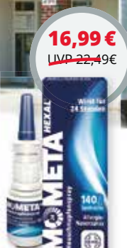
Mometax Hexal Heuschnupfenspray 18 g (100 g = 94,39 €) 1,2)