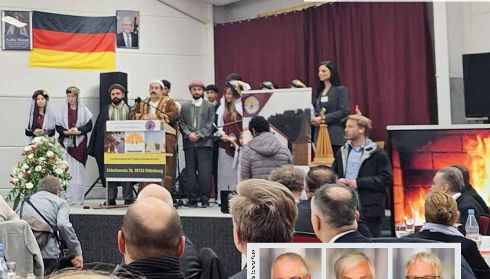
Stimmungsvoller Abend bei den Yeziden beim Start des Erweiterungsbaus