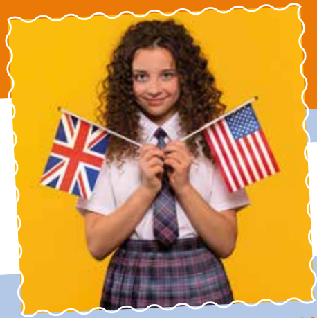
Schuluniform England / USA

Wenn Ihr zur Schule geht, tragt Ihr bestimmt Eure Lieblingsachen. Chic, modisch, sportlich sollen sie sein. Vorschriften für eine einheitliche Schulkleidung gibt es in Deutschland nicht. Fast alles ist erlaubt.