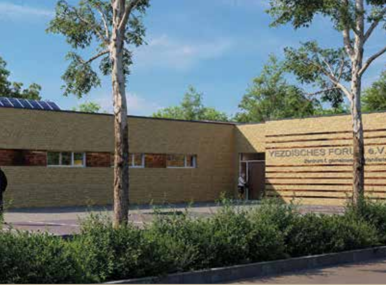
Seitenansicht des Erweiterungsbaues