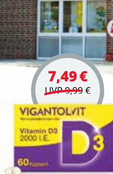
Vigantolvit 2000 60 Kps. 1,2)

1.) Zu Risiken und Nebenwirkungen lesen Sie die Packungsbeilage und fragen Sie Ihren Arzt oder Apotheker. 2.) Unverbindliche Preisempfehlung des Herstellers. Nur solange der Vorrat reicht. Irrtümer und Änderungen vorbehalten. Abgabe nur in haushaltsüblichen Mengen. Angebote gültig vom 03.03.2026 bis zum 01.04.2026.